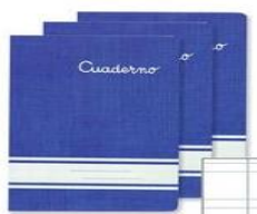
Pauta 3'5 (dos líneas)

Seguir la pauta propuesta de renglón y cuadrícula (generalmente viene en la parte posterior del cuaderno)